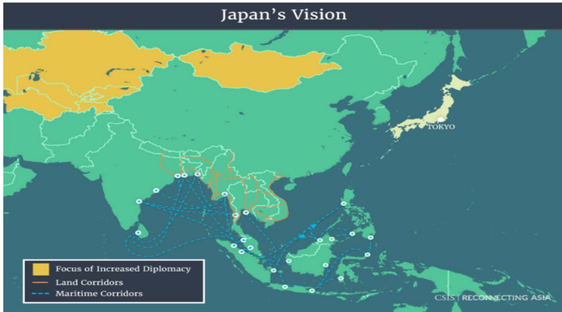
圖二、日本的海上與陸上戰略路線，以及強化外交關係地區地圖