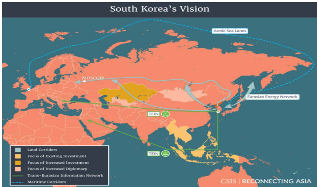
圖三、韓國的陸上戰略路線、北極圈海洋路線與跨越歐亞訊息網路戰略地圖