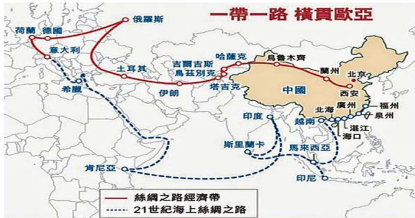
圖一、中國一帶一路的戰略地圖 17

一帶一路戰略啟動多項能源輸送計畫，包括興建中緬油管、開發中巴經濟走廊，透過瓜達爾港連結中亞的天然氣與石油，甚至試圖打通泰國南部的克拉運河， 18 希望中國的能源輸送不要受制於麻六甲海峽的新加坡，同時也在斯里蘭卡可倫坡建立商港，在南部漢班托塔（Hambantota）建造深水港，將中國勢力延伸到南亞，並連接到非洲地區，同時也在南海建立人工漁礁，來防禦美國在亞太的布局。這些舉措無疑讓中國成為亞太區域新的政治、經濟與軍事霸主。