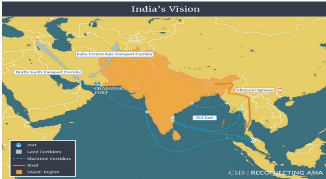
圖四、印度的東進政策與中亞、南亞區域合作聯盟(SAARC)戰略地圖